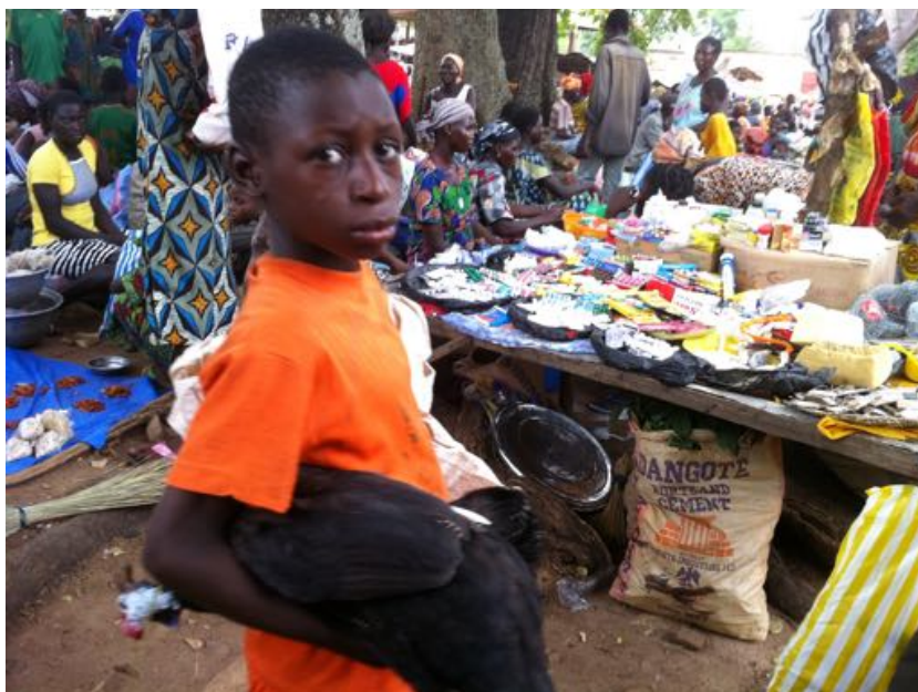
« Pharmacies par terre »