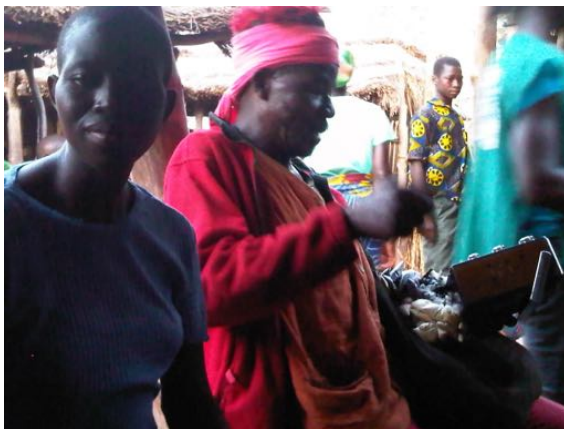
Un guérisseur au marché

Ces produits et « vitamines » sont, bien évidemment, beaucoup plus présents sur les marchés informels que dans les dispensaires ... L'offre rejoint ici – et sans doute construit en partie – la demande ; et le marché hebdomadaire, hors de toute réflexion médicale, correspond au plus important espace de soins et d'échanges « médicaux ».