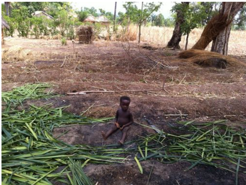
Cet enfant accompagne son père sur son unique parcelle dont les limites sont marquées par les arbres et le mur de la case.

Ces données révèlent aussi un paysage contrasté, traversé par d'importantes différences clivant les mondes urbains et ruraux, et une géographie opposant une zone Maritime à des régions plus pauvres et enclavées ainsi qu'une société globalement structurée par une différence de possibilités accordées selon les genres.